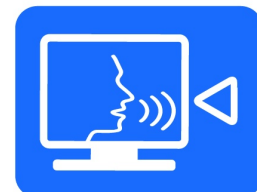
Caméras & Automation