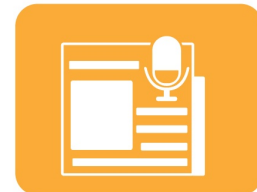
Infos & Flux