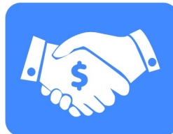
Routage & Facturation