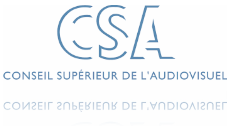
Schéma pluriannuel d'accessibilité 2021-2023